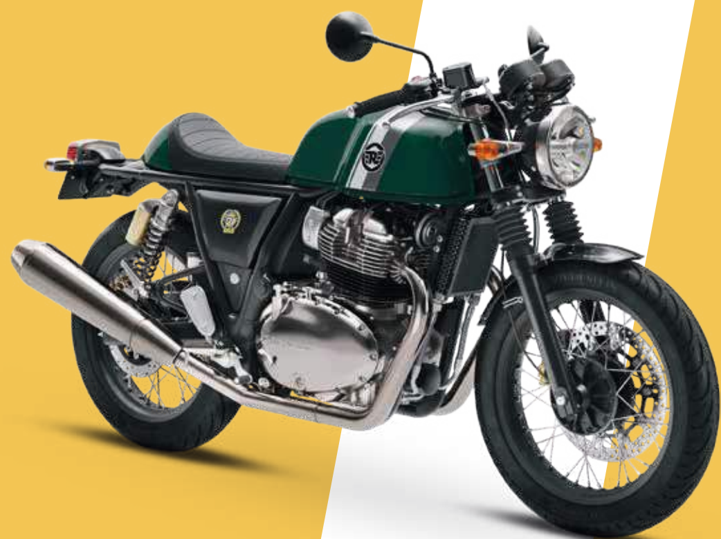
BRITISH RACING GREEN